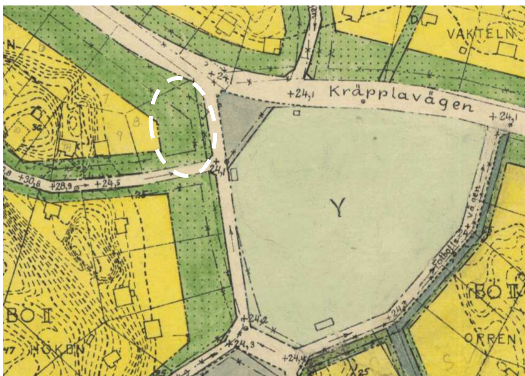
Figur 1. Urklipp ur stadsplan för Mellanområdet inom Stuvsta från 1948. Vit markering visar den del av planområdet där Tjädern 8 ligger i dag.

Fastigheten Tjädern 8 i Stuvsta omfattas av detaljplan som omfattar en stor andel prickmark, vilket innebär byggnadsförbud på delar av tomten. Området där Tjädern 8 ligger planlades år 1948. År 1978 gjordes en fastighetsreglering där Tjädern 8 styckades av från en större fastighet, med resultatet att Tjädern 8 till största delen bestod av prickad mark. Samma år gavs bygglov för nybyggnad av enbostadshus med dispens från stadsplanens bestämmelser.