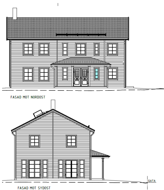
Figur 4. Förslag på möjlig utformning av det nya bostadshuset.