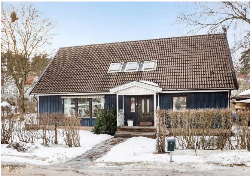
Figur 3. Villan som den såg ut innan den brann ner, uppförd 1978.